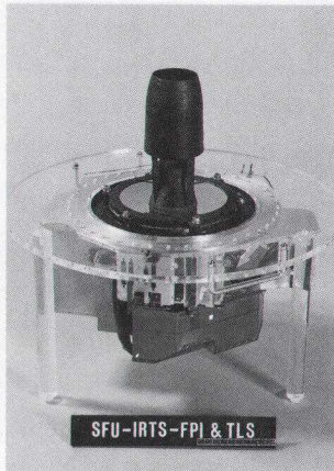
IRTSの心臓部 望遠鏡と焦点面観測装置

要な項目の1つは打ち上げ前の準備作業です。ヘリウムタンクを超流動液体ヘリウムで満たす作業は、衛星の準備作業としては例外的に大がかりな作業となりました。もう1つは、打ち上げた後の衛星の運用、特に姿勢運用です。天体観測のためには真空容器の蓋を開いて、望遠鏡に光を入れる必要があります。しかし一旦蓋を開けてしまうと、望遠鏡が太陽や地球の方向を向くことは絶対に許されません。太陽や地球からの強烈な放射で内部の温度が上がり、液体ヘリウムがすぐに蒸発して、観測が続けられなくなってしまいます。このため、衛星の姿勢変更は、常に失敗の許されないクリティカルな運用となります。関係者の努力と少しの幸運で、IRTSはこれらのハードルをすべて乗り越えました。