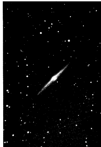
遙かなる宇宙より