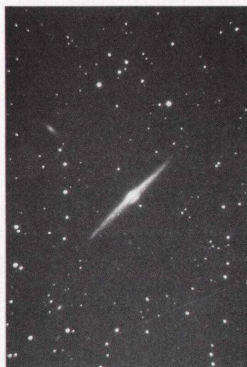
遥かなる宇宙より