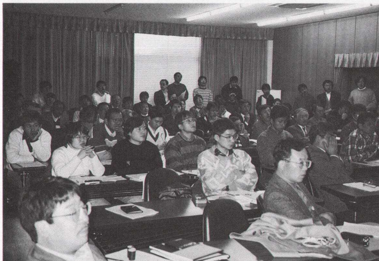
写真2 連日予想をはるかに上回る熱心な参加者が詰めかけたために、会場のうしろの方で立って真剣に発表を聞く参加者。

観測提案（3D分光器，中間赤外線分光撮像装置（MIRFI）等），さらに，すばる望遠鏡用の観測装置としての“主焦点広視野近赤外線モザイクカメラ”の提案があった。最後のセッションである午後には，太陽系天文学，星形成研究，惑星系の形成，銀河団中の銀河の進化，クエーサー・サーベ