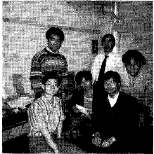
宇宙物理学研究室の研究室風景

千葉大学理学部物理学科に宇宙物理学研究室が誕生して2年が経過しました。研究室には大学院生の数も増え、大規模理論シミュレーションとX線天文衛星のデータ解析を中心とした研究のアクティビティも上がってきたところです。その現状と研究の一部を紹介します。