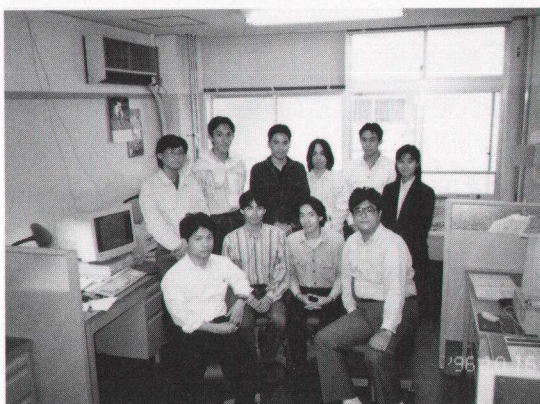
写真1 院生室で全員集合の図.