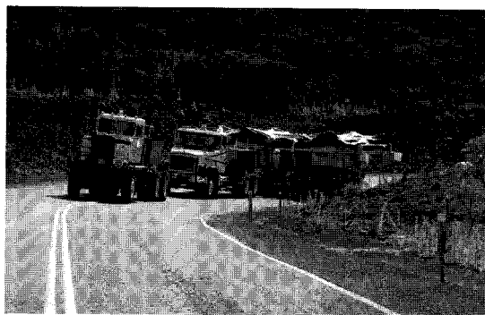
2連の牽引車で登坂。

土曜は、パーカー牧場の牛に見守られながら出発。急な坂道の手前で牽引車の2台目を連結。牛が何頭か、なんだなんだとばかりに走って見に來た。それらをふりきってけっこうなスピードで登坂。観測者用宿泊施設のあるハレ・ポハクで休憩。滯