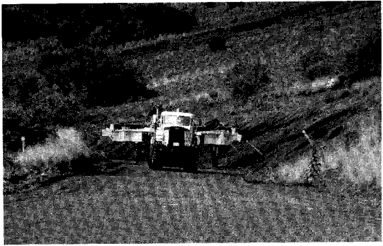
傾斜の急な道でも荷台が水平になるよう調整。