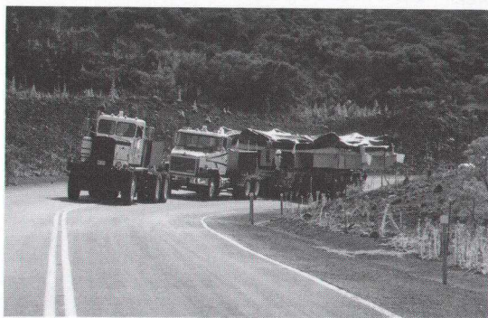
2連の牽引車で登坂。

土曜は、パーカー牧場の牛に見守られながら出発。急な坂道の手前で牽引車の2台目を連結。牛が何頭か、なんだなんだとばかりに走って見に来た。それらをふりきってけっこうなスピードで登坂。観測者用宿泊施設のあるハレ・ポハクで休憩。滞