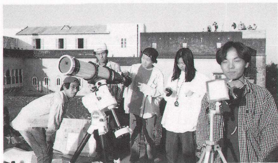
写真2 インドでの日食観測練習の様子