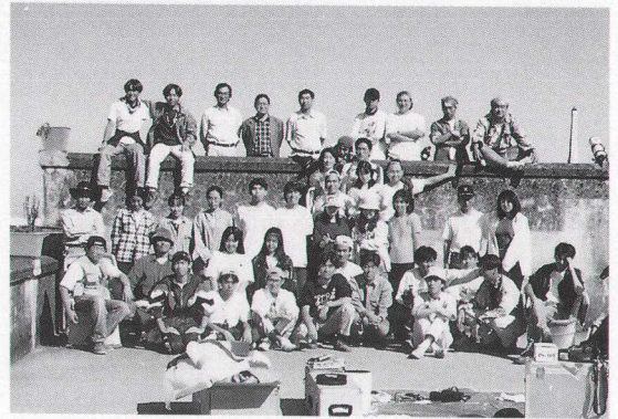
写真1 インド日食観測後の集合写真 (1995年10月24日)

が創立70周年を迎えた記念行事の一つとして、大学院生、大学生、高校生、中学生、教職員92名からなる日食観測団を結成し、1994年11月3日の皆既日食を南米パラグアイとチリで観測しました。学術研究と体験教育の目的を達成し全員無事帰国、成功裡に行事は終了しました。