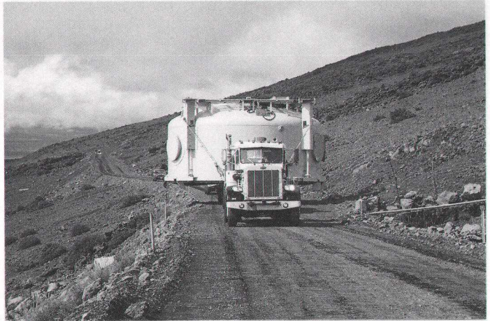
写真2 マウナケアを登る上釜

少し右に寄りすぎ、崖の斜面にお釜のフランジのエッジが当たってしまった。関係者がわっと集まる。ドーリをバックさせたらフランジを養生していたベニヤ板がはずれてしまった。真空蒸着装置の現地責任者がダメージを調べたが、幸いに傷は外側だけで大事には至らなかった。フランジの養生をやり直し始めた頃雨が降り始め、出発する頃には本降りとなっていた。道路が水を含んで光り始め、そのうち道路の表面を流れ始めた。運送責任者は土砂降りの中歩いて慎重に進路を確かめて行く。ぬかるんだ道を時にはドーリーをバックさせ、微妙にコントロールしながら狭い道をすり抜けていった。13時30分、舗装道路に到着。雨も上がりいつもの立食の昼食パーティではあるが、余りゆっくりもしてられない。14時過ぎに出発。ちらちら降り始めた雪が次第に激しくなってくる。路肩には昨夜積もった雪が残り、銀世界となっている。しかしドーリーはゆっくりだが確実に高度を稼ぎ、山頂ドームの進入路入り口に着いた頃には太