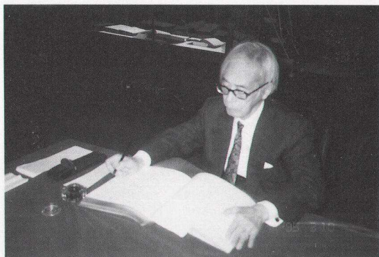
1995年春ロンドン王立協会でのサイン