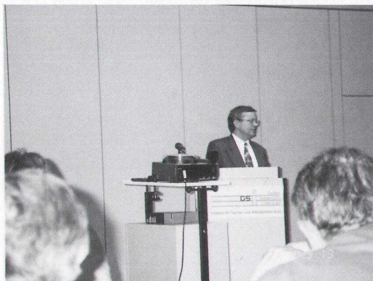
写真3 ポン・ワークショップでまとめを述べる国連宇宙局のH. ホーボールド氏。