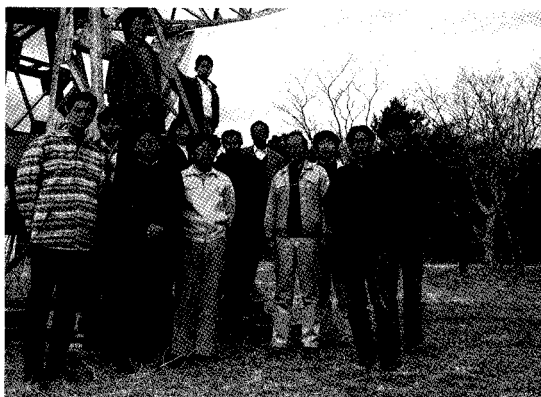
写真1：研究室のメンバー