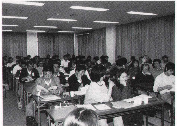
図1 第7回西はりま天文台シンポジウム「プロとアマの交流と協同を深めるために」で発表に聞き入る参加者達。

ところが、その相互間で必ずしも円滑な交流や協同行われているとは言いがたい。そこで、私たちはその重要性に鑑み、プロ、アマの名を冠したシンポジウムを開催することにした。交流や協同が深まれば、もっと大きく日本の天文学の進歩に貢献できるのではないかと考えたのである。