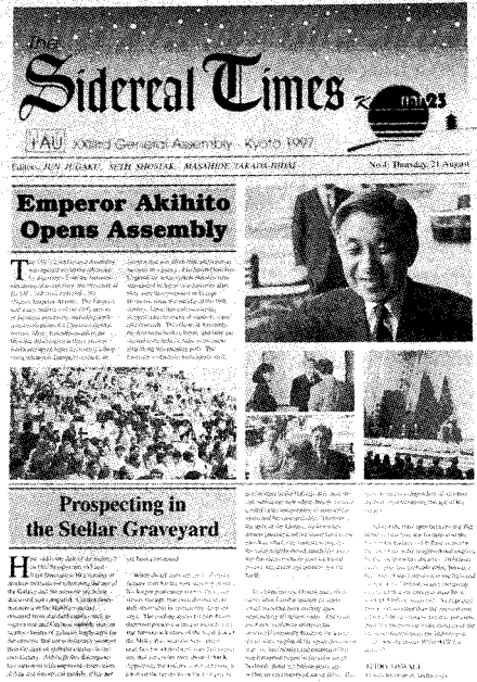
写真5 品切れとなったST第4号

てはなりません、STが取り上げた天文学の記事の中で話題らしきものとしては、ハッブルディープフィールドに発見された赤方偏位 z = 4.9 の銀河、W. Freedmanのハッブル定数 ( H = 73 \text{ km/s/Mpc} ) の決定、ISO (Infrared Space Observatory) による赤外線観測の多くの結果、HALCAによる高分解能画像の観測結果、などでしょう。