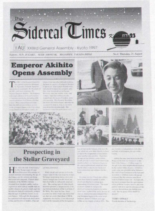
写真5 品切れとなったST第4号

てはなりません、STが取り上げた天文学の記事の中で話題らしきものとしては、ハッブルディープフィールドに発見された赤方偏位 z = 4.9 の銀河、W. Freedmanのハッブル定数 ( H = 73 \text{ km/s/Mpc} ) の決定、ISO (Infrared Space Observatory) による赤外線観測の多くの結果、HALCAによる高分解能画像の観測結果、などでしょう。