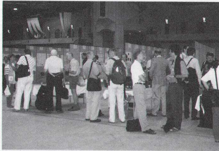
イベントホールに設置されたポスター会場