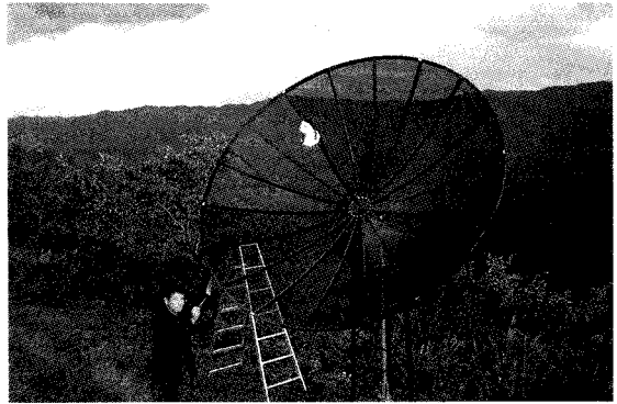
地元の高校生といっしょに組み立てた 3 m アンテナ

また、昨年度末より町内の小中高等学校 8 校すべてと天文台をインターネットで結んでおり、天文教育にとどまらず情報センターとしての機能も有している。このような環境を利用して、尾久土正己は全校生徒約 60 名の県立大成高校美里分校へ出向いて週 4 日非常勤講師として宇宙と情報の授業を行っている。みさと天文台の利用はもちろんのこと、HOU (Hunds on Universe) に参加してアメリカの望遠鏡に観測リクエストを出して授業