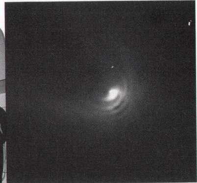
写真3 ハール・ボップ彗星の複雑なジェット (1997年4月16日)

は観望会ごとに1つだけですが、口径 15 cm と 10 cm の大型双眼鏡も用意していますので、何種類かの天体を見ていただけます。社会教育用公開望遠鏡は、観望会以外にも、学生の観測実習、広報・公開・教育用の天体画像を得るための観測、研究のための観測に利用しています。限られた明るい天体しか観望することができない、こんなひどい夜空の環境でも、冷却 CCD カメラの威力にて、観測対象と目的によっては、なんとか本格観測を行うことができます。50 cm 望遠鏡はカセグレン式で焦点距離が 6000 mm と長いので、透明度とシーイングが良好なときには、露出時間を 10 分以上かけると V と R バンドで 19 等級後半から 20 等級前半の恒星状天体が写ります。I バンドでは、限界等級は 21 等級に迫ります。この望遠鏡で観測を開始した 1995 年には土星の環が見えなくなる現象があり、1996 年には百武彗星、1997 年はハール・ボップ彗星と、マスコミ関係が大きくとりあげ、一般市民が大きな関心を示した天体現象が相次ぎ、広報普及室が観測し公表した画像は大貢献でありました。今年、テンペル・タットル周期彗星のモニタ観測に力を入れました。我々スタッフは、彗星をはじめ太陽系天体を専門に研究テーマとしていることもあり、観測対象は広報用と研究用にどちらにも共通しており、一石二鳥の結果を得ることができたのです。