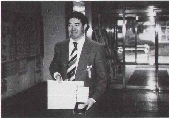
写真3 日本天文学会授賞式 1995年3月(東京学芸大)

口径が大きくなると最低倍率も上がり視野が狭くなり検索の効率が悪くなります。それでも発見が多いのは日本より快晴率がよく計画的に検索できるからでしょうか?