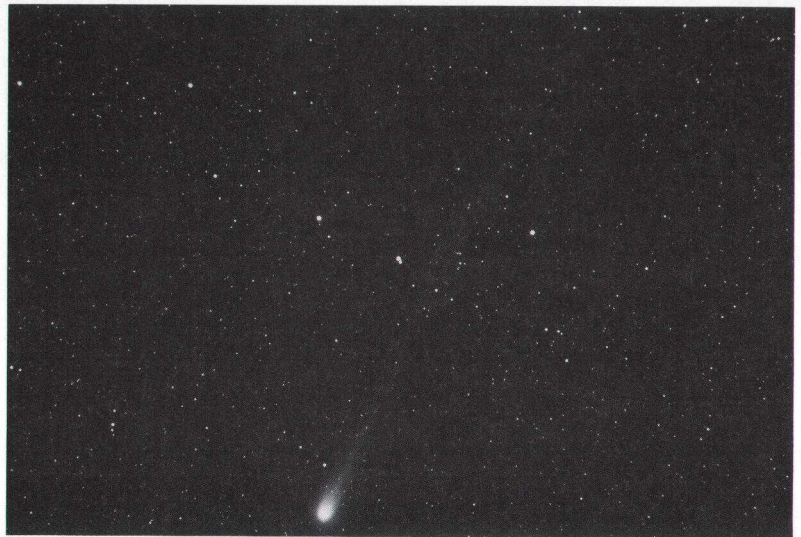
写真1 1996 B 2 “百武彗星”（バックの明るい星は北斗七星です。） 1996年3月25日 23 h 30 m

新彗星の出現はまったく予想できません。今夜あるいは明日の明け方、新彗星が現れるかも知れません。そんな期待感が彗星搜索の魅力だと思います。