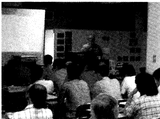
図1 みさとシンポジウム'98の様子。ギルバート・クラーク（アメリカ）によるTIEの紹介。