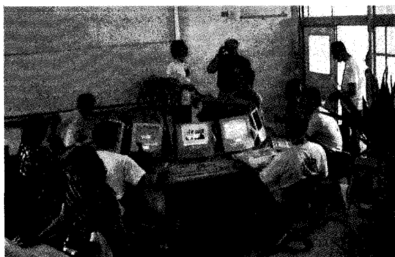
図5 コンピュータ教室で小惑星サーチのカリキュラムを皆で実践。コンピュータ教室は非常に明るくてきれい。観葉植物もある。学校とは思えないほど。

れることになっている。HOUプロジェクトでは、すでにカリフォルニアのロイシュナー天文台に設置された75 cm専用望遠鏡を用いた超新星サーベイがすでに動き始めている。このようにリアルサイエンスをリアルサイエンティストの援助のもと、生徒がしっかりと継続して行っているプロジェクトは科学教育全体でもあまり例がないだろう。日本からもすばる望遠鏡からの画像提供、各地の公共天文台からの画像提供、小惑星サーチをしている日本のアマチュア天文家との連携等が望まれている。