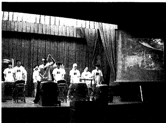
図2 レセプションで美里太鼓を熱演する高校生。迫力ある演奏に圧倒される。