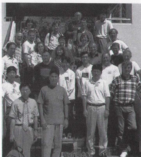
図4 大成高校美里分校の玄関前にて GHOU の集合写真。

3日目、HOU 関係者のみの Global Hands-On Universe Workshop (GHOU) が始まる。HOU プロ