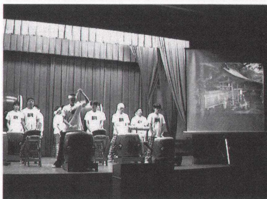
図2 レセプションで美里太鼓を熱演する高校生。迫力ある演奏に圧倒される。