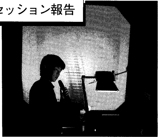
しし座流星群の「大火球のスペクトルの時間変化」についての発表

が、講演申し込み開始とともにそのような心配は吹き飛び、最終的には、北は北海道から西は鳥取県まで、当初の予想をはるかに上回る17件の講