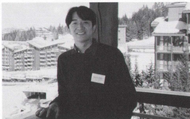
研究会が開かれたホテルのベランダにて

この研究会では、MACHO、銀河団、大規模構造、宇宙背景放射に関する重力レンズ現象という大変幅広いテーマについての理論的、観測的な研究の活発な議論がなされました。特に、ここ約一ヶ月の間に幾つかのプレプリントで見られるように、数年前までは実現が非常に困難だと思われていた“cosmic shear” (遠方銀河への介在する物質分布による弱い重力レンズ効果) が統計的に有意に測定されたという4例ほどの最新の報告がなされ、遂に宇宙の大規模構造を形成する暗黒物質の分布を直接“観測”できる時代が来たのかという強い感動を受けました。また、既に VLT による cosmic shear の初期成果の報告もありました。さらに驚くべき事は、cosmic shear の信号は非常に小さく、それを抽出する方法は専門的であるにも関わらず、それらの独立な観測結果が殆んど一致していたことでした。しかし、依然として新たな測定が必要であることは間違いなく、出来るだけ広い観測領域 (約1平方度以上) を必要とするため、やはり「すばる」が最も適した望遠鏡であるはずだと改めて感じました。実際、海外の研究者からも何度も