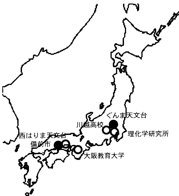
図1：今回のキャンペーンに参加した人たちの観測場所の分布。同時観測の点では、南北に並んだほうが望ましいと考えたが、実際には、このように、どちらかという東西に並んだ分布となっている。結局、もっとも距離が離れた2地点での画像が、同時性・天候条件の両面から最適な画像の組となった。

試験撮影の結果、表1のような仕様で撮影するとよいことがわかった。さらに、この条件で時間において撮影した2枚の印画を比べてみると、月が