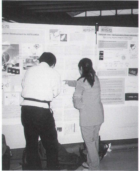
シンポジウムのポスター会場にて (左が筆者)。

シンポジウム終了後、ミリ波・サブミリ波域の装置開発で最先端を行く研究グループの一つである Köln 大学 (Köln は大聖堂で有名な街です) の第 1 物理学研究所を訪問し、開発の現場を見学させてもらいました。Köln 大学は音響光学型電波分光計の開発では世界の頂点に立っており、私自身がこれまでに音響光学型分光計の開発に携わっていただけにたいへん興味深かったです。特に、アレイ分光計と相関器 (相関器の方は実物を見ることができませんでしたが、ポスターを前に説明していただきました) には、音響光学型分光計の可能性