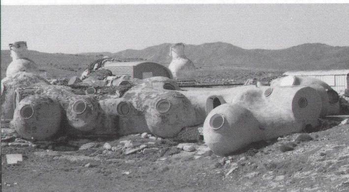
カレランにある光干渉望遠鏡の研究棟。これがれっきとした研究室 の集合体である。遠方に2台のとっくり型望遠鏡が見える。

に示しているのが、カレランにある光干渉望遠鏡とその研究棟である。写真にも示すように、とっくり型という望遠鏡の形も面白いが、その研究棟があたかもSF映画の月面基地かのような形態をしていたことには驚かされた。これは、このプロジェクトのリーダーの趣味(?)だということだった。しかし、必ずしも使いやすいものではないと思うのだが。ちなみに、とっくり型の望遠鏡は、望遠鏡自体が野ざらしなのはさておいて、望遠鏡の駆動システムにギアを使っていない。このような発想は、どこからくるのであろうか。