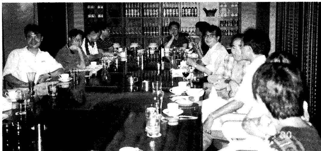
研究会後に開かれたバンケットの風景

と感じられた。今正に、サブミリ波干渉計を使って、一步踏み込んだ観測を行う必要がある時期に来ているのだろう。これらのレビューに引き続き、SMAでどのような研究をするべきか、何が最も面白いかを議論した。参加者の積極的な発言の甲斐あって、熱い議論を交わすことができたのではないかと考えている。ただ、議論はまだまだミリ波干渉計の延長というところから今一つ脱し切れていないというのが、正直なところだろうか。ミリ波干渉計の研究の単なる延長ではなく、ミリ波干渉計ではできなかった何か新しい観点を見いだすにはもう少し時間がかかるかもしれない。今回のこの交流を近い将来のSMAを用いた共同研究に発展させていきたいものだと考えている。