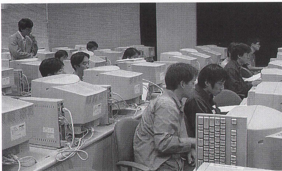
茨城大学での実習風景。みんな真剣な表情でディスプレイに向かっています。講師が後ろから一人一人の状況を確認しています。

く、実際に数値シミュレーションのコードを書き、実行できる人を育てたいと考えたからです。通常の講義あるはセミナーでも教えられそうですが、適切な講師がない場合や、適当な数の受講者が集まらないことがあります。数値シミュレーションを研究の主な手段としている研究室でも、毎年入ってくる新人の数は限られています。数人を相手に講義をするのは、教官にとっても負担です。学年の違う学生を一緒にしたセミナーでは、知識や理解度に大きな開きがあるので、適当なレベルを保つのが困難です。講師となるべき教官もそれぞれ得意分野があるので、合同で講義をしたら、質もあまり効率も高くなると考えたのです。