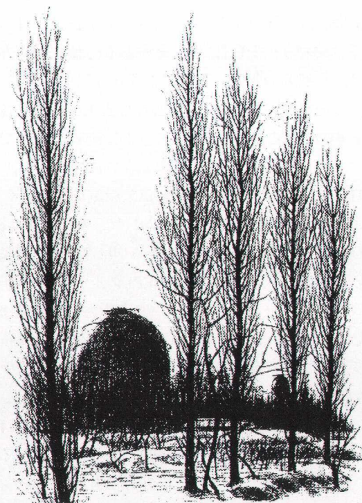
国立天文台 65センチ望遠鏡

このように考えると、天文学者はこれまで金食い虫の汚名を着せられ、また民生に対してはさっぱり貢献しないではないかという批判を受け、自らも敢えて抗弁もしなかったが、よくよく考えると天文学者ほどクリーンで国の顔に、国の宝に相応しいものはないと思えてくる。さらに進んで地球の顔であり宝でもあり得るとなれば、気分の幸せこの上もないことである。