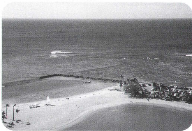
ホテルの部屋(25階)からの眺め。本当にキレイな海でした。

私は、「あすか」衛星のセイファート1型銀河「MCG-6-30-15」の長時間観測からえ