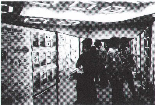
ポスター会場の様子