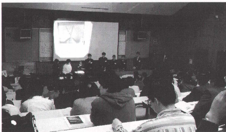
写真2 「ぐんま天文台で観測した太陽と星の動き」

今回の反省点としては、まず口頭セッションの時間が延びてしまい、以降のセッションに御迷惑をかけてしまったことがあります。発表の時間をできるだけ確保するとともに、セッション運営を改善していかなければなりません。また、ポスター会場が分かれていて、関連の深い天文教育のポスター