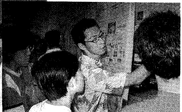
ポスター会場の様子