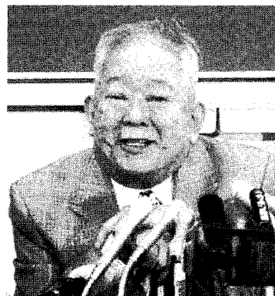
発表後の記者会見での小柴昌俊先生