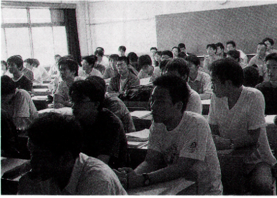
写真1：サマースクール講義風景