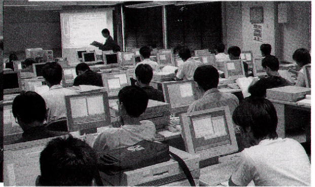
写真2：サマースクール実習風景

ました。天体グループでは、さまざまな講師を通して統一性のある講義テキストを作成するために、8月の暑い名古屋で缶詰状態の合宿も開きました。実習教材に関しては、今回のサマースクールが京都と千葉、天文台といった手元の計算センターではなく、名古屋といった外部の計算機環境を利用させていただくということから、動作確認を念入りに行いました。(直前まで動作確認がかり、講師側としては結構冷や汗ものでした。)