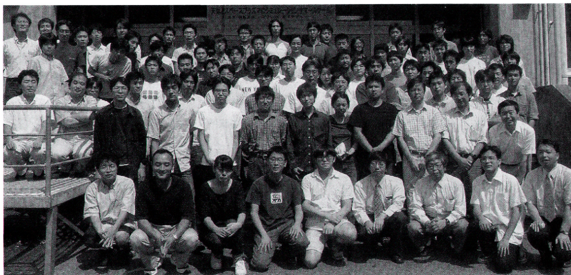
写真3：サマースクール参加者集合写真