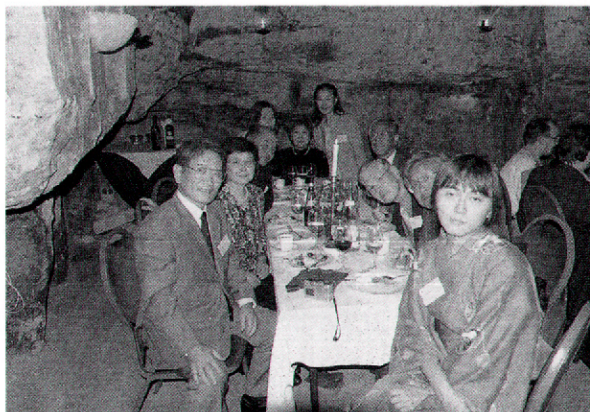
洞窟でのバンケットの風景。

合える天文学者は「研究者」として羨ましい」そうです。また、特許関係のアドバイスはありがたかったです。