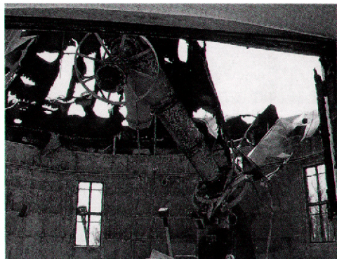
Yale-Columbia 26 インチ屈折望遠鏡