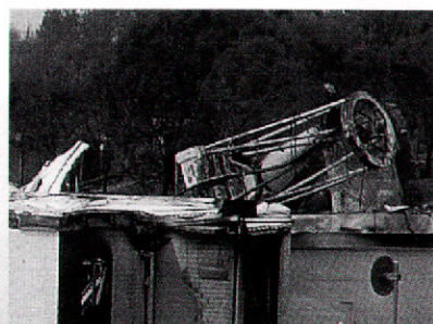
50 インチ MACHO 反射望遠鏡