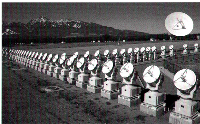
図 3：現在活躍中の野辺山電波ヘリオグラフ。背景は八ヶ岳と 45 m 電波望遠鏡