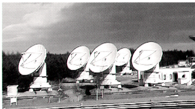
図 2： 現在活躍中の野辺山ミリ波干渉計

午後には、ALMA 計画の現状の報告、及び議論が行なわれました。報告では、日本分担分の予算を獲得すべく引き続き努力を続けており、予算がつくことを大いに期待していること、などが説明されました。また、プロトタイプアンテナの評価がアメリカのソコロの近くの VLA サイトで始まり、日米欧の 3 台のアンテナが揃いつつあること、また、受信機用低雑音ミキサーなどの開発の拠点となる建物が、三鷹の国立天文台本部で整備されつつあること、などが発表されました。