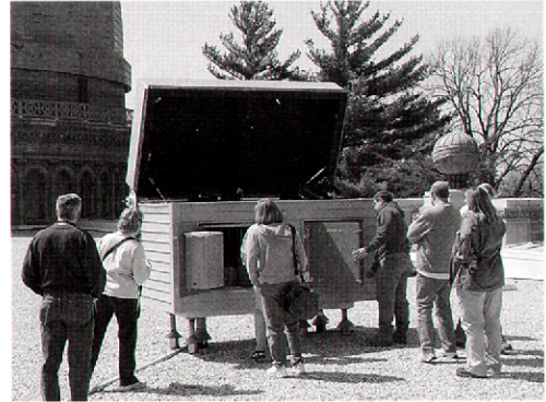
図 4 YRTs と世界最大の口径 1m 屈折望遠鏡のドーム（左）