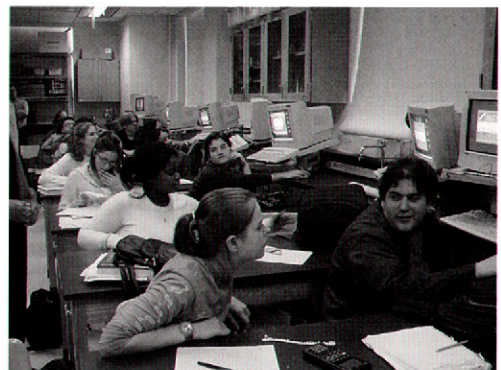
図7 Oak Park & River Forest 高校での KIT を利用した天文学の授業の様子