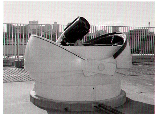
図 1 北の丸望遠鏡の全景

HOU の活動は米国、日本のほかにもスウェーデン、オーストラリア、ドイツ、フランス、ポルトガル、英国、ロシアの教師や研究者が参加し、Global Hands-On Universe（略称 GHOU）を組織している。HOU の代表者であるカリフォルニア大学バークレー校のカール・ペニーパッカー氏