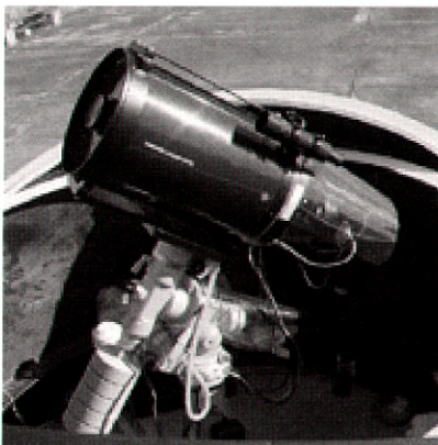
図3 望遠鏡, CCDカメラと架台