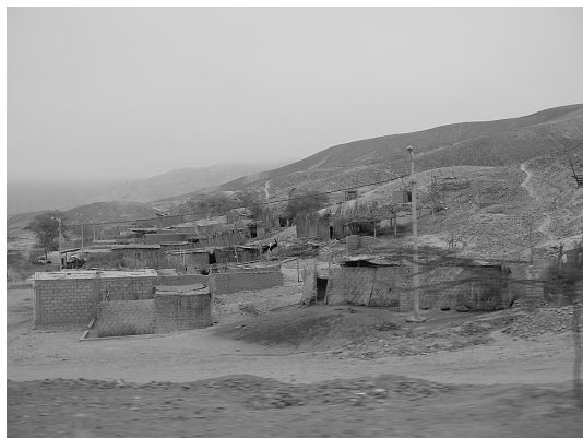
写真 13 都市近郊の砂漠の掘建て小屋。アンデスの高地から裸一貫で移住してきた一家は、砂漠に杭を打ち、このようなあばら屋で起死回生の新生活を始める。この国には、まだフロンティアが残されている。

バス/タクシーの客にお菓子類を売る。信号待ちの車の窓をふいてチップをもらう。通行人の靴を磨く。子供も一緒になって、学校にもいかずに家計を支える。こうして数年貯金すると、その金で三輪オートバイを買い、無認可のタクシー営業を始める。さらに数年頑張ると金を貯めると、今度は中古の自動車(4輪)を買い、運賃をより高く設定して無認可のタクシー営業をする。こうして生活が潤うにつれて、家は植物シート壁から日干しレンガ壁に改築され、屋根がついたりする。子供も学校に通えるようになる。このように現在のペ