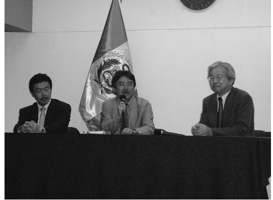
写真 12 リマ工科大学でのパネル・ディスカッション。ペルーの天文学を今後どう進めるか、が話し合われた。