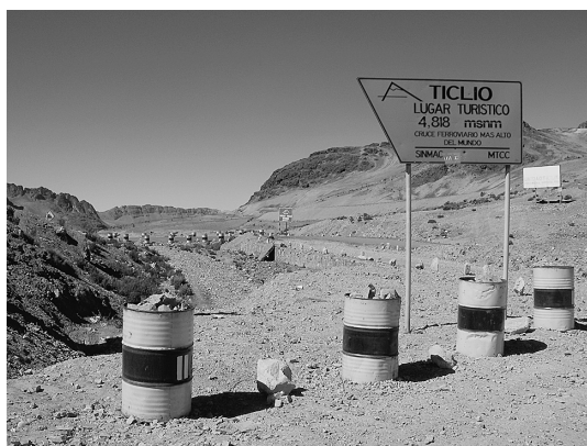
写真7 ペルー・アンデスのティクリオ峠（海拔4,818 m）。ここには確かに「黒い空」があった！

セッション後にパラボラアンテナの見学会があった。立派に見える衛星通信用パラボラアンテナも、近くで見るとあちこちに錆や傷みが見られ、相当に手間と金をかけて改修しないと望遠鏡への転用はできないだろうと思われた。聞けば、電波望遠鏡としてしつらえ直すには、約500万円ほど必要なのだと言う。制御建屋内部も見学させてもらったが、伽藍としている。運用停止後に何