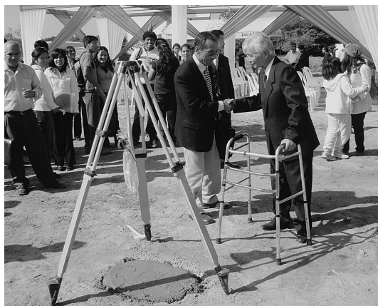
写真4 イカ大学での太陽観測所起工式の様子。三脚の下のコンクリートは、今しがた参加者によって打ち込まれた基礎である。睦氏の背後で怪しいワルツを踊っているのは筆者の家族である。