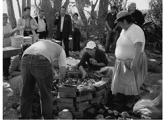
写真9 IGP ワンカイヨ観測所での「パチャマンカ」。アンデスの特別料理である。われわれのために、観測所員と近隣住民とで早朝から準備して下さった。

見学会後に 3 km ほど離れた IGP ワンカイヨ観測所に移動する。敷地にはアルパカ数頭が散歩して、雑草処理をしている。バスから降り立つと一面に食べ物の美味しそうな匂いが立ちこめている。主催者のお志で、観測所員や地元の人たちによって特別な歓迎料理が作られていたのである(写真9)。「パチャマンカ」(ケチュア語で「大地の鍋」の意)というこの地方のお祭り料理で、地面に掘った穴に羊肉、鶏肉、ジャガイモ、空豆、トウモロコシのちまきを植物の葉にくるんで入れ、アルファルファ(牧草)をたっぷりかけて焼け石とともに土に埋めると、何時間もかけて蒸し焼きにしたものである。これは地元でも滅多に食べることでできない特別料理で、格別の歓迎の意を表しているものである。観測所員の設営してくれたテント会場でわれわれはパチャマンカとワインを堪能した。ワンカイヨでの高級ホテルのフロントデスクに飾られた絵画がパチャマンカを料理する場面であったこと、われわれのバスの運転手さんがやたら嬉しそうにはしゃぎながらパチャマンカ