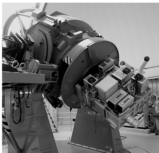
写真1 かなた望遠鏡のカセグレン焦点部に搭載されて稼働中のTRISPEC (長さ1,200 mm × 幅1,000 mm × 厚さ400 mm, 重量450 kg)。

1994年、Z研初大学院生と科学研究費A:「広波長域低分散分光測光による天体動スペクトルの研究」を元手に、出発した。目標は、1) 広波長域 ( \lambda_1 \sim \lambda_2 ; \lambda/\Delta\lambda \sim 200 ), 2) 測光 ( I ), 3) 偏光 ( P ), そ