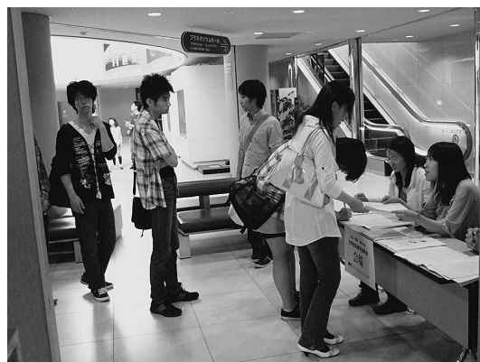
図2 午前10時過ぎの受付風景。

これらをみると、やはり、 各大学の発表時間を短くしても1会場 で実施し、詳しいことをブース