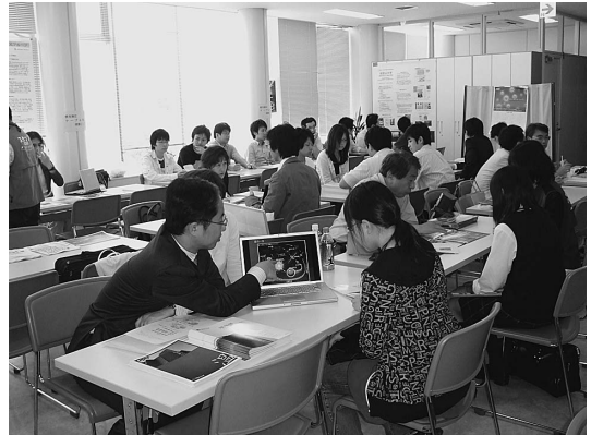
図4 ブース見学タイムの会場風景(多目的室)。各ブースでは丁寧な説明を受けられたようだ。

初回と同様に、ランチ&ブース見学タイムはたっぷり2時間とった。また今回は、3部屋を確保し、大学紹介の会場(2部屋)とは別の広い部屋