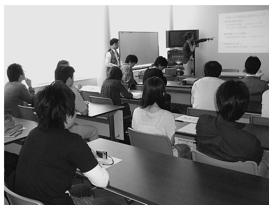
図3 大学紹介タイムの会場風景。研修室(上)と会議室(下)の2会場で並行実施した。