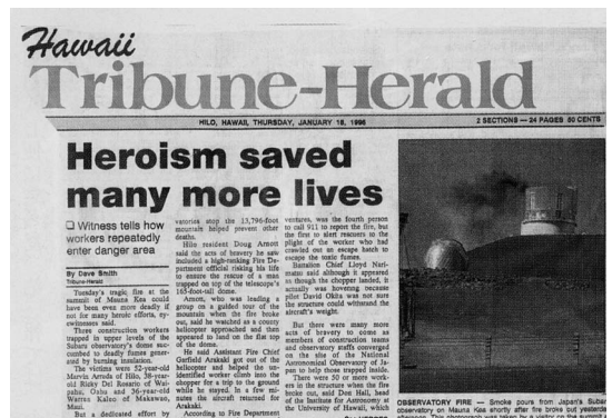
図2 すばる望遠鏡のドーム火災について伝える「ハワイ・トリビューン・ヘラルド」紙。

ただドームでは、1996 年 1 月の悲惨な火災が、生々しい記憶として残っている。3 人の現地作業