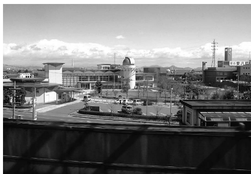
図1 新幹線の車窓から見たハートピア安八天文台。

星見会での一般公開観望はメインの活動です。星見会はプラネタリウムでの導入解説で始まり、天文台と小型天体望遠鏡を並べた屋上で天体を案内します。