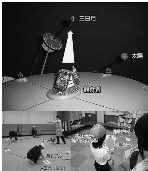
図2 月の満ち欠けの教具での演示(上)と実験(下).

も実践し好評を得ています。このため、口コミにより情報が広がり、毎年新たな学校からの申し込みがあり、現在の町外学校の割合は約8割です。