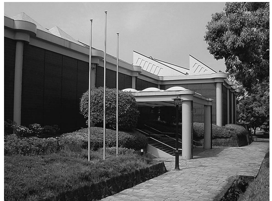
図1 熊本博物館外観。

そのプラネタリウムを今年3月にリニューアルしました。プラネタリウムは、現在の博物館本館建設に伴い設置されましたので、34年目を迎えます。これまでの観覧者数は190万人に上り、熊本県民が一人1回は見た計算になります。1992年に、投映機本体や制御装置などを更新していますが、今回は座席やドームスクリーンを含めた全面