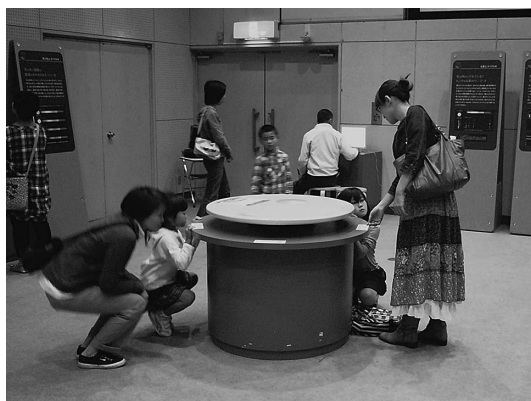
図4 企画展「宇宙の謎を解き明かす」。巡回展示物の一つであるドップラー効果体験装置。

博物館の展示活動として年に数回開催する特別展・企画展では、天文に関する展示も行っています。今春には、日本天文学会創立100周年記念の企画展「ガリレオの天体観測から400年 宇宙の