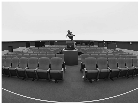
図2 新しくなったプラネタリウム。