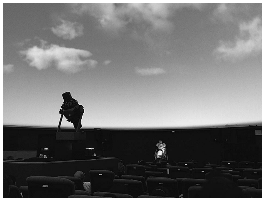
図3 物語の朗読を交えた特別放映の様子。

番組制作では、総合博物館としての利点を活かした取り組みを行っています。リニューアル記念番組として制作した「星が見てきたKUMAMOTO」では、渾天儀の運動をCGで再現したり、西郷星（火星）の登場する錦絵とともにそのときの星空を再現したり、館収蔵資料を活用した分野の垣根を越えた番組作りを行いました。