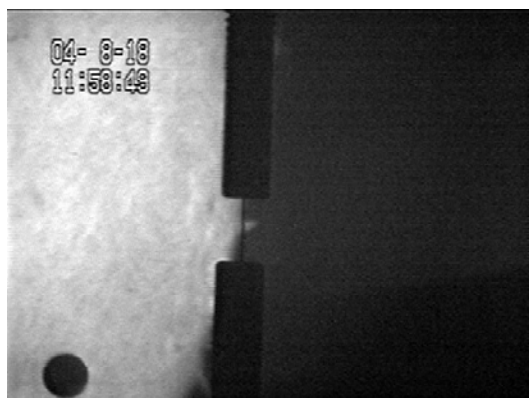
図1 プロミネンスのH \alpha 画像