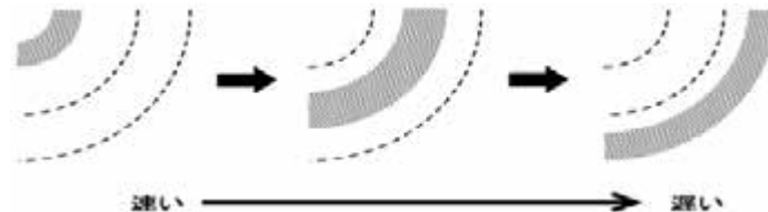
図2) 膨張する穴の模式図

誕生した星が、星風により周りの分子雲の運動を加速させることで、分子雲に膨張する穴のような構造を見ることができるのではないかと考えた。膨張している様子は図2)のように穴の内側に視線速度の速い分子雲があり、外側にいくにつれ視線速度の遅い分子雲があることで確認できるので、視線速度分布を示したチャネルマップを作った(図3)。