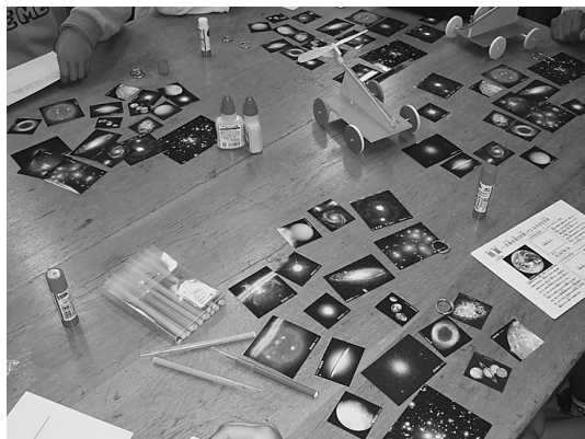
図5 写真を並べたところ。今回はセミナーの時間が限られていたので、一つずつ切った図を用意しました。