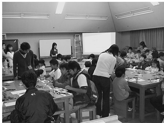
図7 工作室でのセミナーの様子。