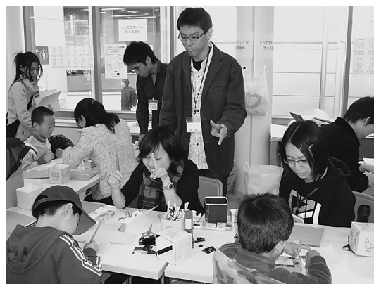
図9 ブース出展 2.

限があり、当日にあらかじめ整理券を発券し、約30人で締め切られます。今回行った宇宙図鑑は、このようなものがジオ・カーニバルでは初めての試みだったためか、あっという間に整理券がなくなり、大好評でした。子ども優先ではあるものの、年齢制限はなかったため、小学校低学年から中学生の子どもたちが参加してくれました。なかには、宇宙にたいへん興味をもっておりほとんどの天体を知っているという子どもも、また宇宙のことを全く知らないが両親に薦められてきた子どもなど、興味の度合いも年齢もさまざまな中でセミナーが始まりました。