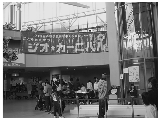
図1 第7回ジオ・カーニバル(2006年11月11日、12日 於 大阪市立科学館)。

以下にその詳細と活動を報告します 2) 。この報告を通して、みなさまの今後の天文普及活動の参考になればありがたいと思います。