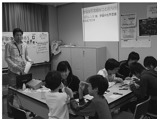
図8 ブース出展 1.

ジオ・カーニバルは2日間にわたって開催されました(図8, 図9)。セミナーは両日とも人数制