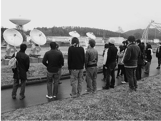
写真3 野辺山太陽電波観測所での見学の様子。