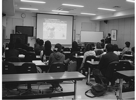
写真4 国立天文台三鷹での講義の様子。

憩を挟み、昼過ぎには三鷹に到着した。三鷹では国立天文台、宇宙研の研究者による、「ひので」の研究やそれを受けての次期太陽観測衛星計画 SO-LAR-C 、さらに三鷹の地上太陽観測施設の見学を行った。このころには、すっかり打ち解けた参加者たちの興味がはっきりわかるようになってきて、理論的な側面に強く興味をもつ者、装置開発に関心がある者、と、気が早すぎるが、将来が楽しみになってきて、(このツアーをやってよかった!)という、思いがこみあげてくるのを感じた。